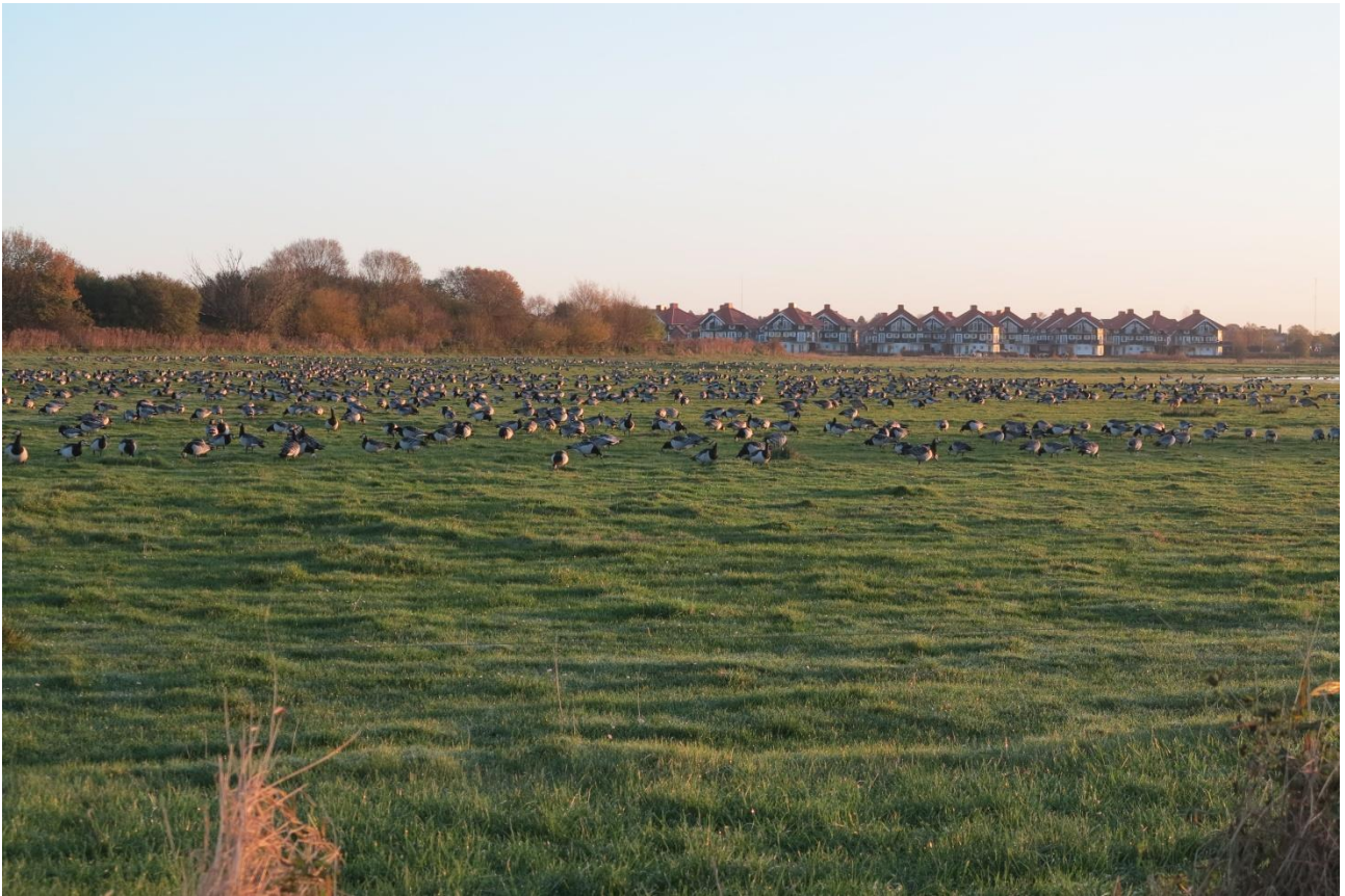
Bogense Vestre Enge. Masser af bramgæs i forgrunden med "Tyroler-husene" inde i Bogense i baggrunden.

Det der er spændende ved området er, at der ligger hundredvis af boliger lige op ad området. Det betyder, at der er mulighed for at folk kan nyde fuglene og få en forståelse for, at sådanne våde, velplejede arealer er vigtige for fuglene. Selv om der bor mange mennesker og der går tur på veje og stier, tager fuglene stort set ikke notits heraf, fordi der ikke drives jagt i området.