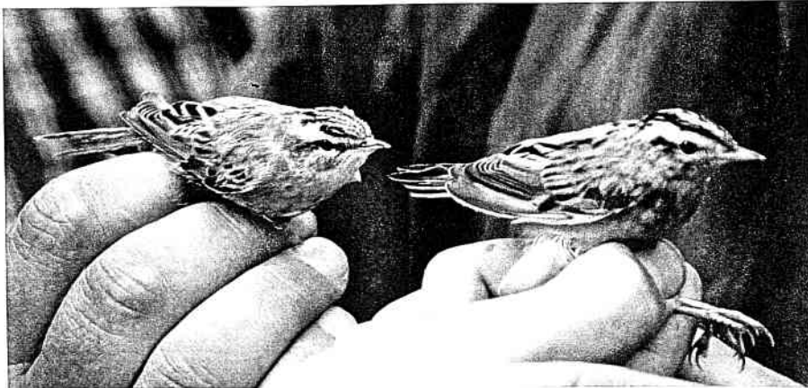
Sivsanger og Vandsanger, Keldsnor september 1998