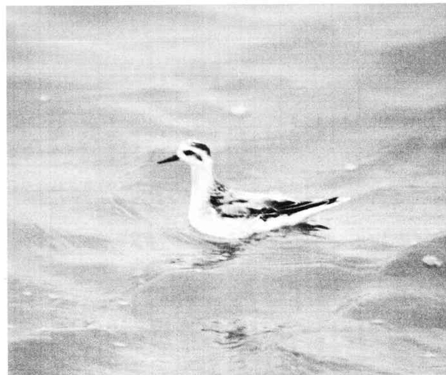
1k Thorshane, Helgoland 1998

Kl. 16.00 afgik færgen tilbage mod Büsum. Efter indtagelse af turens bedste måltid, nemlig dagens ret på Funny Girl, kørte vi hjemad efter tre gode dage med i alt 125 fuglearter.