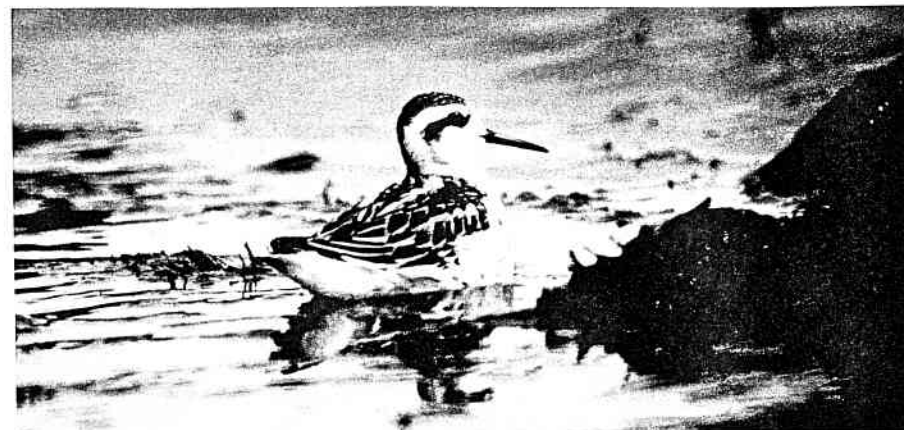
Odinshane var en af efterårets invasionsarter. Her en 1k, september 1998

En meget sen Rørhøg trak ud fra Dovns Klint 26/10. Ved Brændegård Sø blev en meget tidlig Fjeldvåge fotografe-