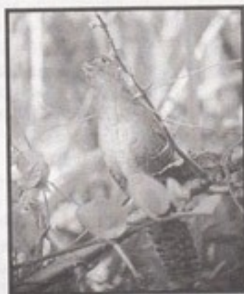
og en Zapata Wren hoppede nysgerrigt op