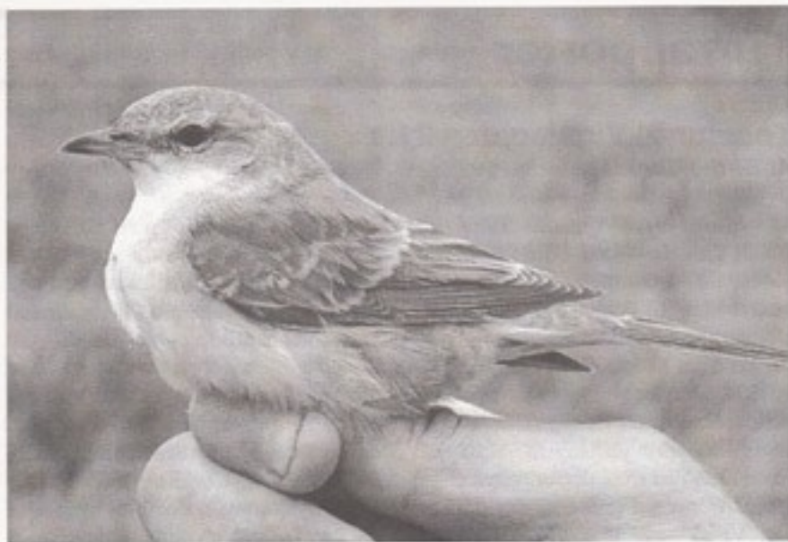
Høgesanger 1k.