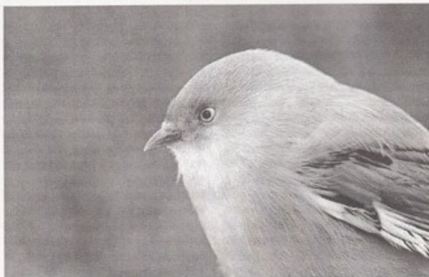
Skægmejsen har haft stor glæde af de opsatte redekasser.

det Erik Larsen fra Tved. Tak til begge for Jeres store arbejde og ikke mindst tålmodighed med alle os frivillige.