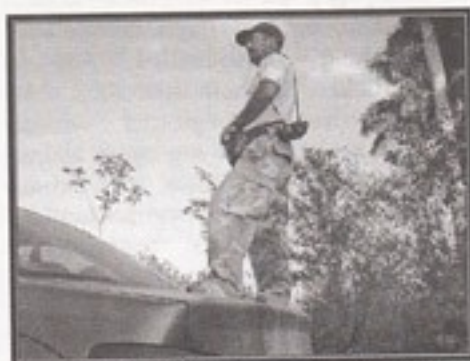
Det hjalp for El Chino at skabe sig et overblik fra vores bil -

af sine 1 ½ m, tændte for båndoptageren, og et ekko startede nede fra roden af det største sivmiskmask. Lyden arbejdede sig op ad røret som en anden Rørsangertype, og der sad den jo vores meget ønskede fugl. To minutter efter kom en Red-shouldered Blackbird, en anden endem, vi manglede, og aldrig siden fik, og landede i toppen af palmen. Sådan!