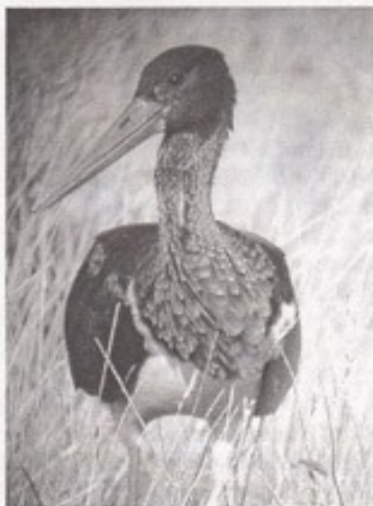
Sort Stork.

30/8-1/9 1 1k R Gulstav (LBL, ELM m.fl.).