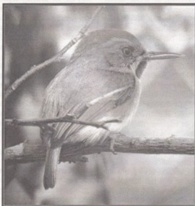
Cuban Tody – et noget aparte bekendtskab