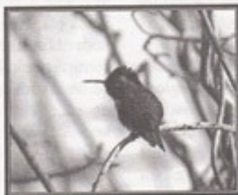
Et kort øjeblik sad verdens mindste fugl helt stille

Der var liv i reservatets skove de morgener. Cubas eneste gøje (Cuban Parrot) så og ikke mindst hørte vi en del til, og efterhånden kom der tre spættearter og gav opvisning. Selv den relativt sjældne Fernandina's Flicker blev set upåklageligt. Den smukke trogon (Cuban Trogon), Cubas nationalfugl, havde vi tit fornøjelse af, og ikke mindst den lille hidsige Cuban Tody blev vi meget fine uvenner med, når den kom og nærmest hvædede af os i hele sin 10 cm lange farvedragt. De mange overvintrende amerikanske skovsangerarter stod heller ikke tilbage i deres farvepragt. Der var mange Amerikanske Tårnfalke,