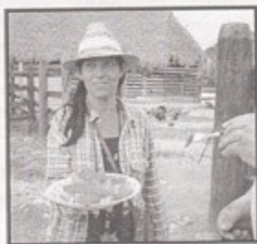
men der gik papaya i den - ikke flere fugle den dag.....

Næste morgen var vi parate til et nyt område, og kørte i mørket de 40 km ad snoede veje til Najasa. Endnu et skovrigt område med masser af småfugle. Vi havde satset på at score 4 specialiteter dér, men fik kun den ene hjem: Cuban Parakeet, som vi dårligt kunne undgå med den støj, den udsendte. Vi fik påduttet en guide til reservatet. Hun var imidlertid så genert, at hun ikke turde fortælle os, hvor de specielle arter gemte sig. En mere moden kvinde tog charmerende over, men snart gik der papaya i den, så hverken Cuban Grassquit eller Giant Kingbird kom i bogen.