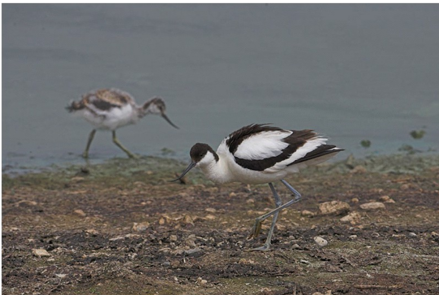
De smukke klyder har her sikret næste generation, her piler ungen i baggrunden.

Det er fascinerende at opleve skovsneppens skumringstræk. Tag ud til et godt overskueligt skovparti, fx i Hvidkildeskovene, Vornæs Skov eller Nørreskoven en lun og vindstille aften omkring solnedgang. Hold øje med lufrummet og lyt efter sneppens knorten og pisten. Og tag hjem med en oplevelse mere i naturrygsækken.