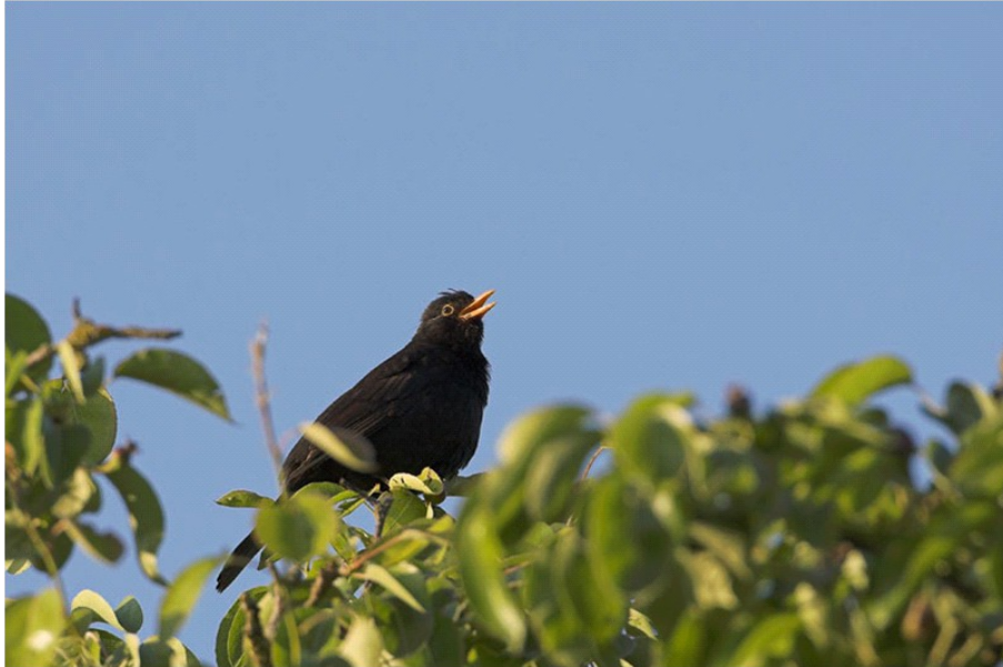
Solsortens sang er en af de allermest skattede lyde i naturen og kendt af menigmand. Fra frugttræets top lyder det smukke sangforedrag i hver dansk have.

I de nyudsprungne bøgeskove ved Skjoldemose og via Kroghenlund til lergravene ved Stenstrup og mange overraskelser venter. Isflugl, lille præstekrave, gråstrubet lappedykker, blishøne og måske en gul vipstjert.