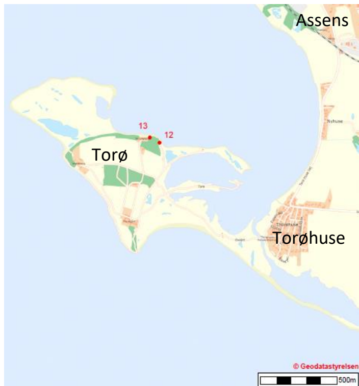
Kort over de to kassers placering på Torø i Lillebælt.

Heldigvis giver vi ikke op og kasserne bliver tilset hvert år i første halvdel af maj. Vi har nemlig lovet skovejerne, at vi er ude af skovene, førend bukkejagten går ind den 16. maj.