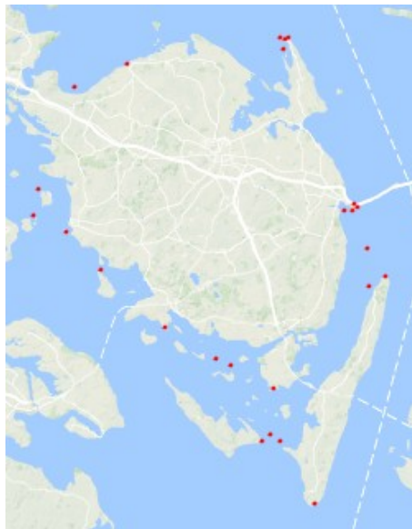
Forekomst af Sortgrå Ryle på Fyn de seneste 5 år (2013 – 2018) registreret i Dofbasen. .

Link til de seneste 14 dages observationer af Sortgrå Ryle på Fyn i Dofbasen. Normalt ankommer de første Sortgrå Ryler til Fyn i september måned, dog er der i Dofbasen for Fyn i de seneste 25 år registreret en enkelt Sortgrå Ryle sidst i august 2007. De sidste fugle forlader igen Fyn i løbet af maj måned.