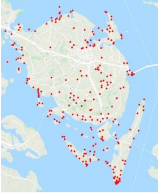
Forekomst af Stenpikker på Fyn de seneste 5 år (2013 – 2018) registreret i Dofbasen. .