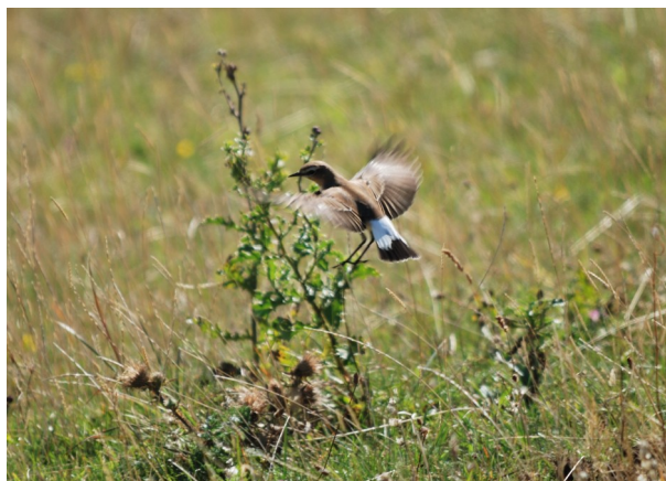
I flugten ses det karakteristiske mønster på halen – omvendt sort T i spidsen og hvid basis og kanter.

Stenpikkeren har en karakteristisk opret stilling, når den sidder hævet over landskabet på en sten eller en pæl. Den laver ofte nogle små vip med kroppen, mens den observerer omgivelserne. Når fuglen flyver, og specielt ved landing, ses det letgenkendelige mønster på halen, som er et godt kendetegn for arten.