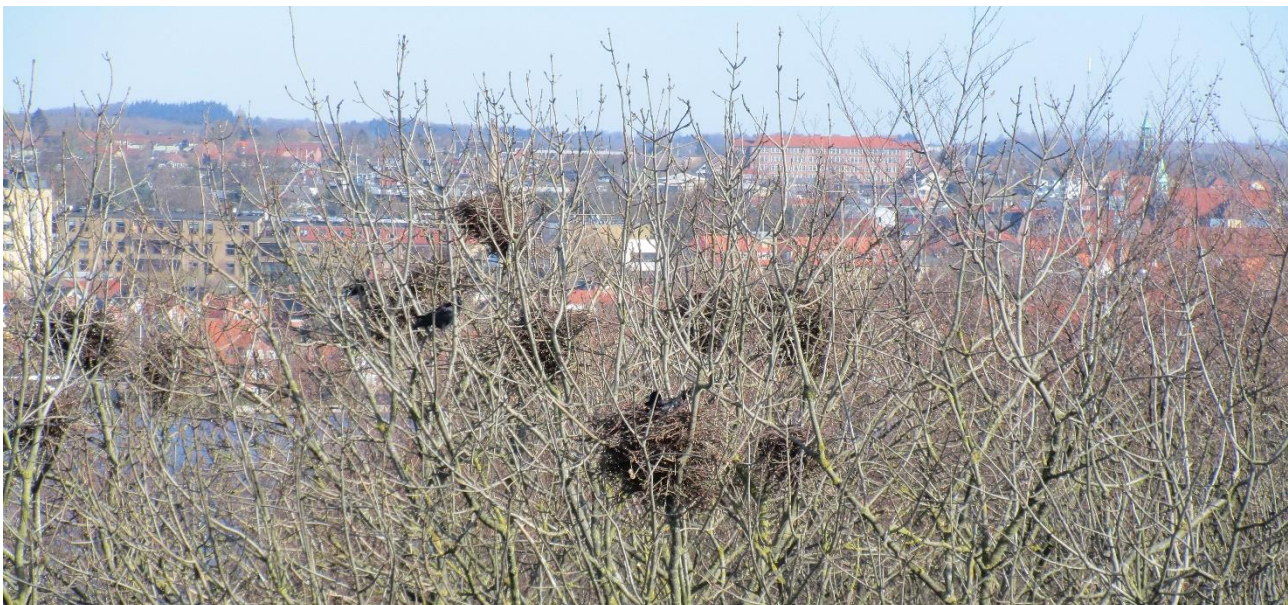
Dele af Rågekolonien i Braten Skov på Tåsinge set fra Svendborgsundbroen. I baggrunden Svendborg.

Ynglesæsonen startede forholdsvis tidligt efter den milde vinter. Nogle kolonier er besøgt og optalt flere gange for at få verificeret tallene. Dette er især sket, hvis første besøg ikke har vist tegn på liv. I år er kolonien i Braten Skov på Tåsinge vokset og man kan nu på begge sider af Svendborgsundbroen få et sjældent indblik i Rågens privatliv i øjenhøjde.