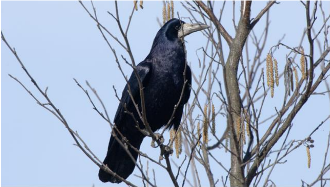
Rågen er Svendborgs signaturfugl.

For 13. år i træk har jeg været rundt i Svendborg og omegn for at tælle Rågerne op i deres kolonier, et arbejde, der kun bliver større år for år, idet både forladte og nyopdagede kolonier skal besøges. I 2016 er besøgt 52 lokaliteter.