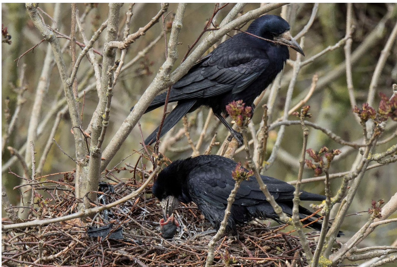
På billedet fodres ungen den 16. april 2017.