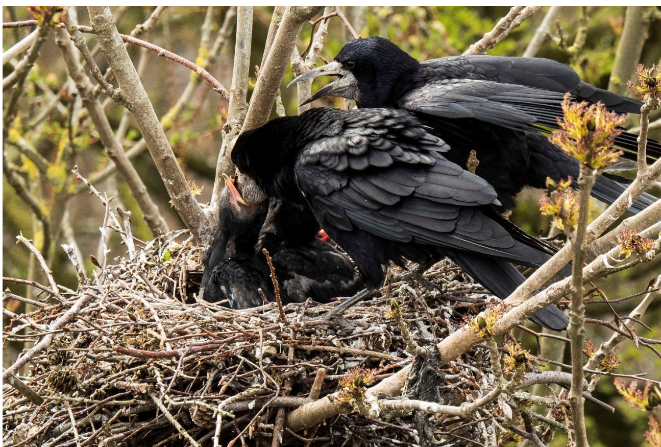
9 dage senere er ungerne vokset betydeligt. 25. april 2017.

Sidste år (2016) blev der ifølge Jægerråd Svendborg nedlagt 1406 Rågeunger i perioden fra 1. maj til 15. juni. Tallene omfatter den såkaldte regulering i kolonierne, også dækker også bekæmpelse udenfor "den gamle Svendborg Kommune", men renser man tallene for kolonier udenfor denne, når tallet op på 815.