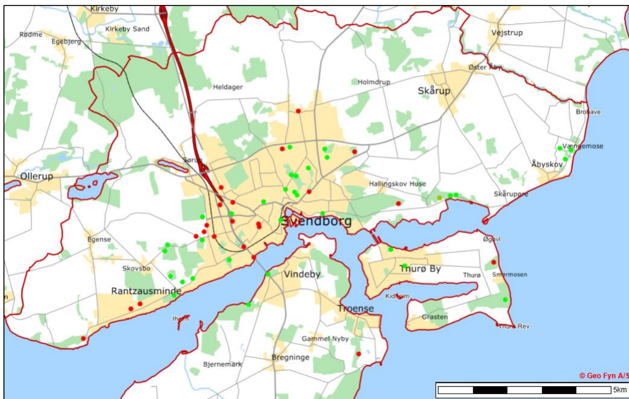
Kort over Svendborgs Rågekolonier gennem alle årene. De aktive kolonier i 2017 er markeret med lysende grøn prik, mens kolonier, der nu er forladt, er markeret med rødt. På næste side ses et skema med tallene fra de sidste 14 år.

2004. Og 13 reder færre end sidste år. Altså uændret niveau .