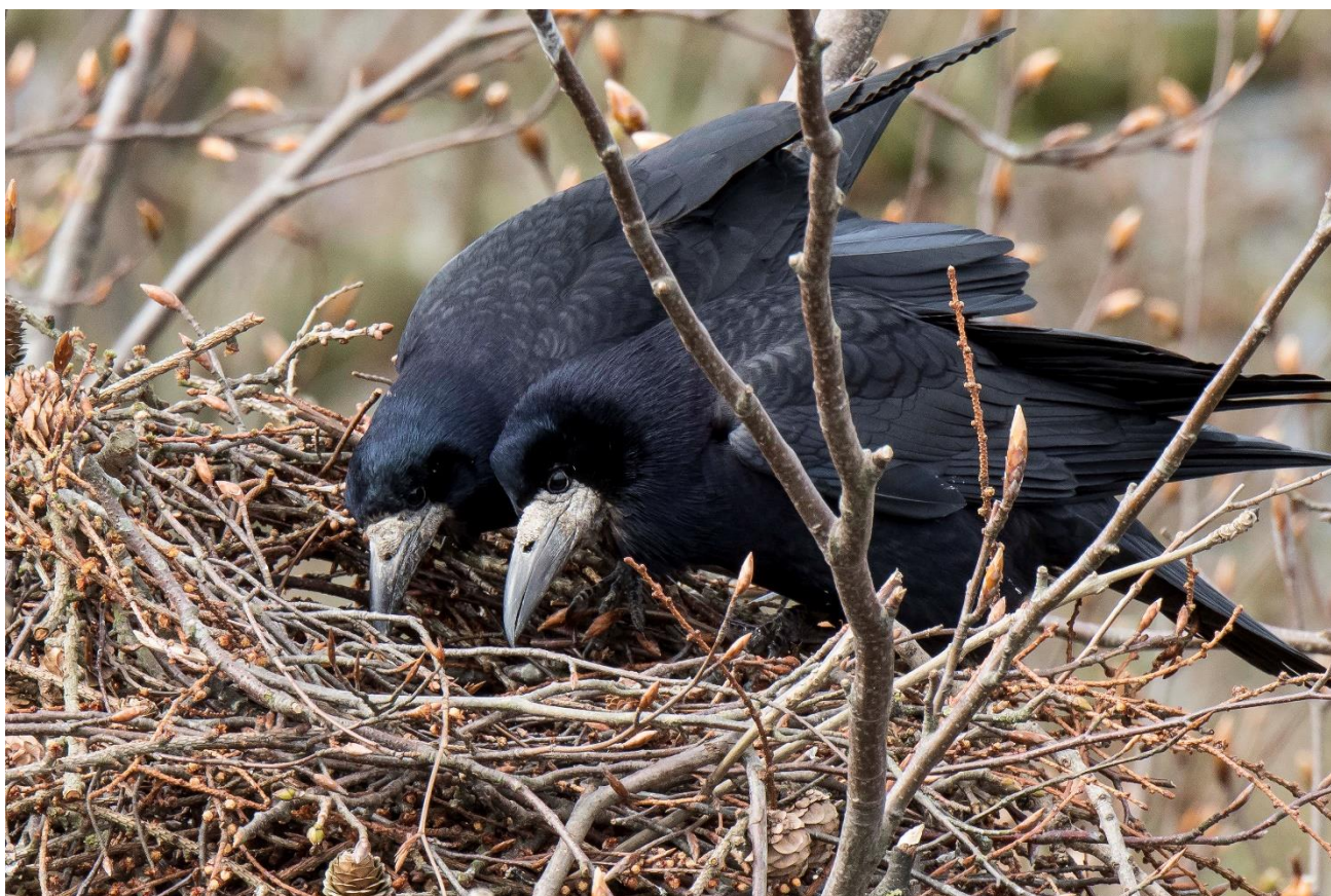
Uden at ville tillægge Rågerne menneskelige egenskaber, så synes parret her at udstråle nysgerrighed, stolthed og hengivenhed overfor de små, der skjuler sig i redens dyb.