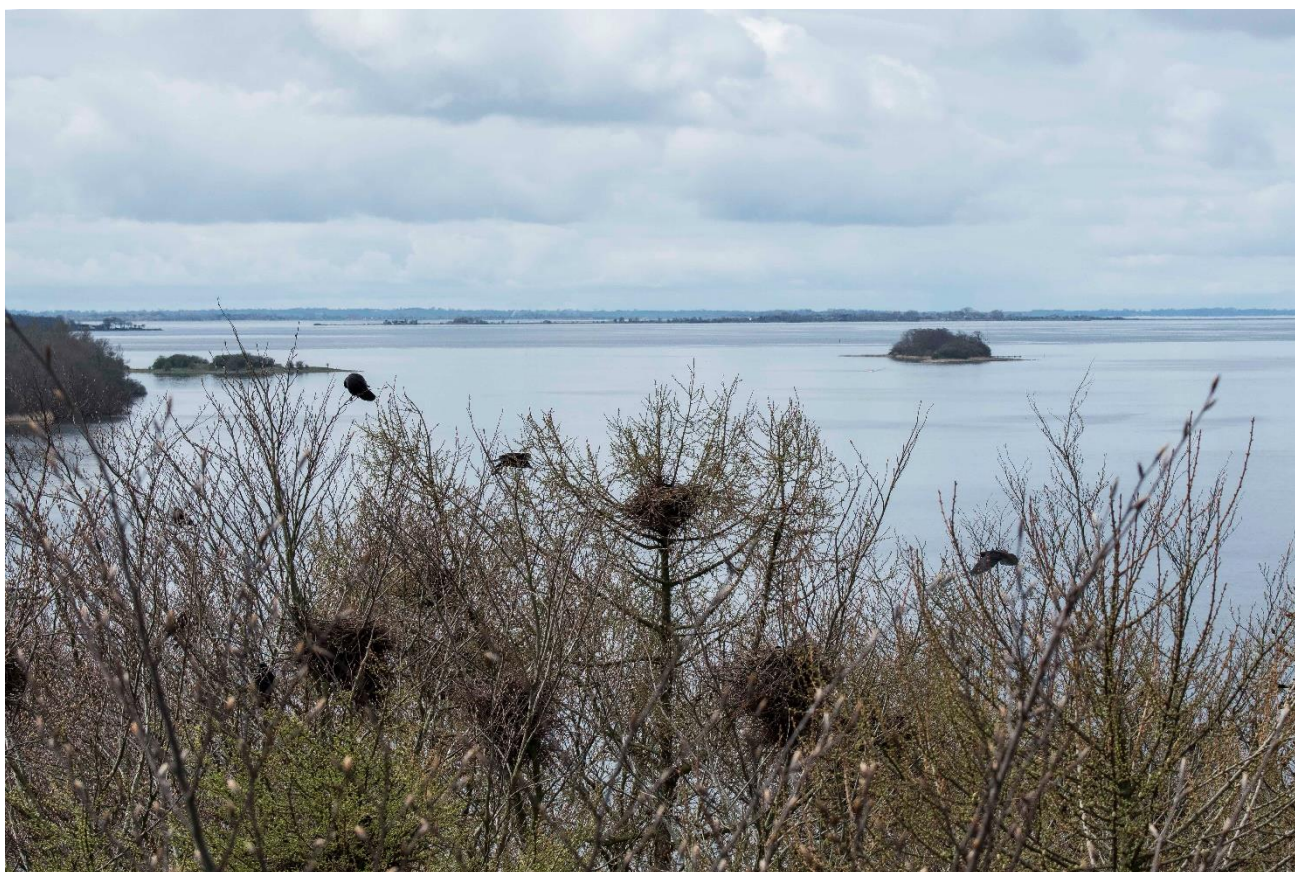
Værelse med udsigt. Her ses kolonien i Braten Skov vest for broen.