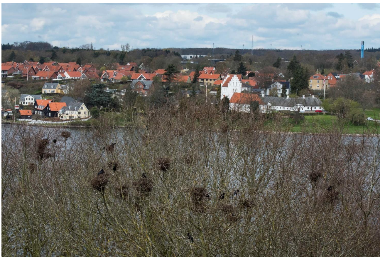
Kolonien i Braten Skov på Tåsingesiden af Svendborgsundbroen er tre år gammel og er vokset meget. Det velkendte billede af Svendborg med de røde tage og Skt. Jørgens Kirke. Rågen er Svendborg signaturfugl.

Kolonier bliver pludselig affolkede, mens andre etableres og vokser næsten eksplosivt. I år er kolonien i Braten Skov på Tåsingesiden vokset og man kan på begge sider af Svendborgsundbroen få et sjældent indblik i Rågens privatliv i øjenhøjde, hvad Erik Thomsens flotte billeder fra april giver det bedste indtryk af.