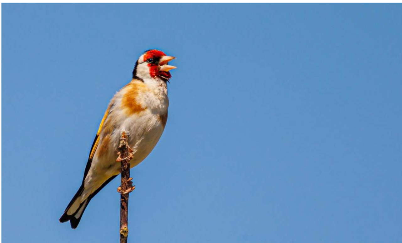
Den farvestrålende Stillits. Sådan ser det ud, når Vorherre har tørret alle sine pensler af i dens fjer.

Dengang var det, det skete en Dag, da Vorherre sad i Paradiset og malede Fuglene, at Farven i hans Malerpotte slap op, saa at Stillidsen slet ingen Farve havde faaet, hvis ikke Vorherre havde tørret alle sine Pensler af i dens Fjer”.