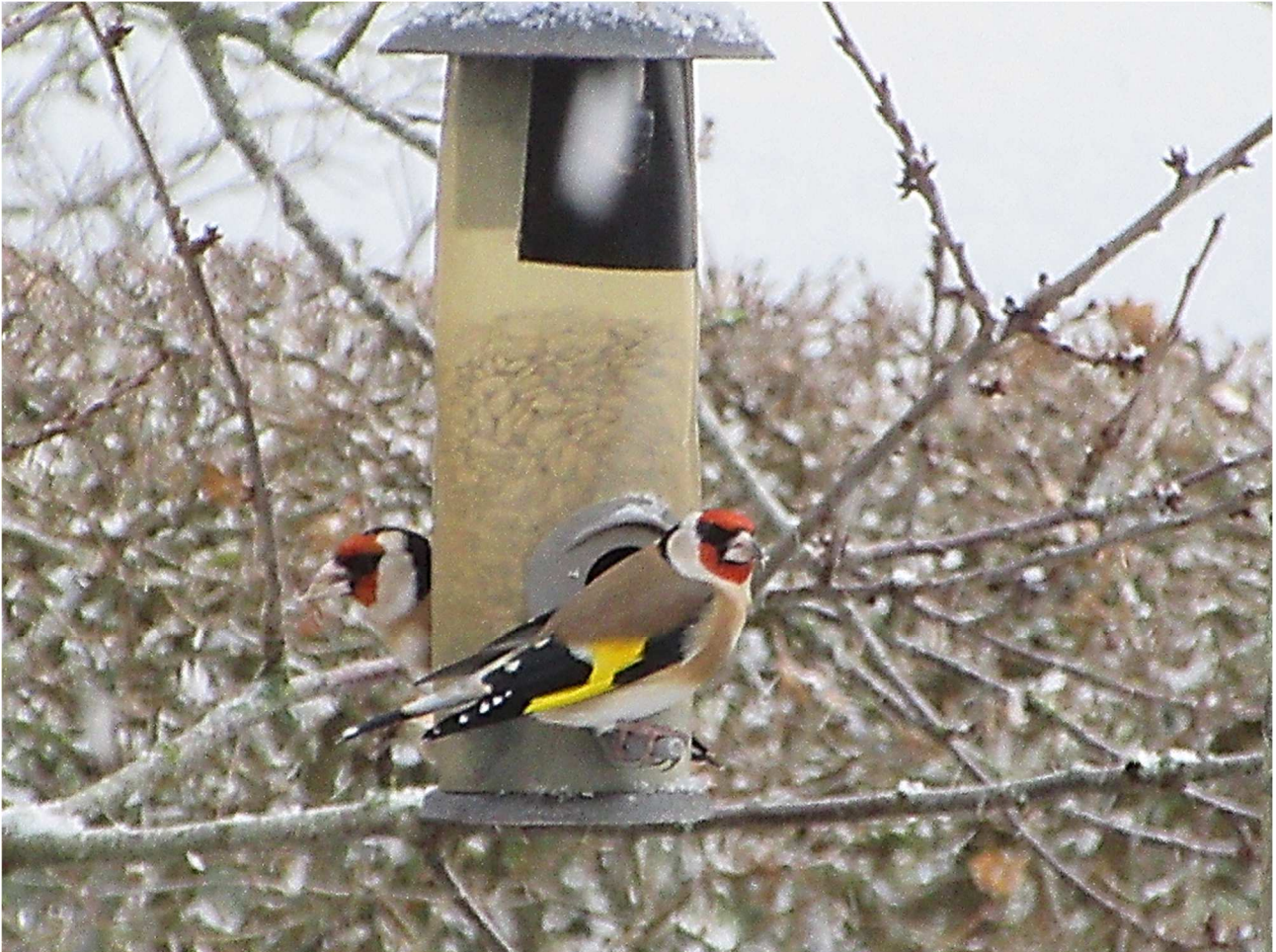
Stillits på min frøautomat. Som det ses, så er jeg ikke fuglefotograf, så dette er blot et dokumentationsfoto.

Antallet af daglige Stillits'er på min helårsfoderplads lige udenfor vinduerne svinger mellem 6 og helt op til 30. Det er en kærkommen gave, at disse muntre og spraglede fugle har fundet vej ind i min hverdag. Jeg ser ofte flokken i luften, når de ankommer til de højeste træer og derfra dumper hurtigt ned til madskålen, der som nævnt består af afskallede solsikkefrø. Stillits'en har simpelthen ikke værktøjet til selv at afskalle solsikkefrøene, i modsætning til flere andre finkefugle, som fx Grønirirken og Bogfinken med bedre næbkræfter.