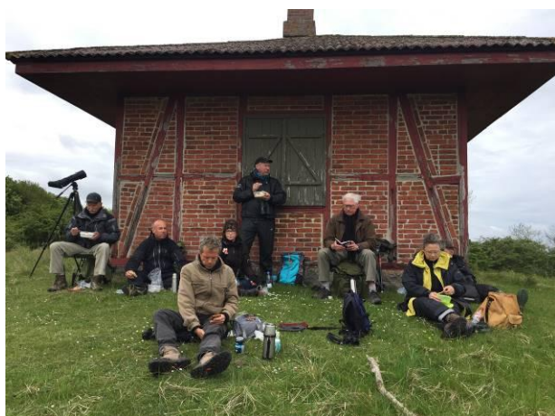
Frokosten indtages ved Jagtpavillonen

Teleskoperne er indstillet på ørnere den langt væk.