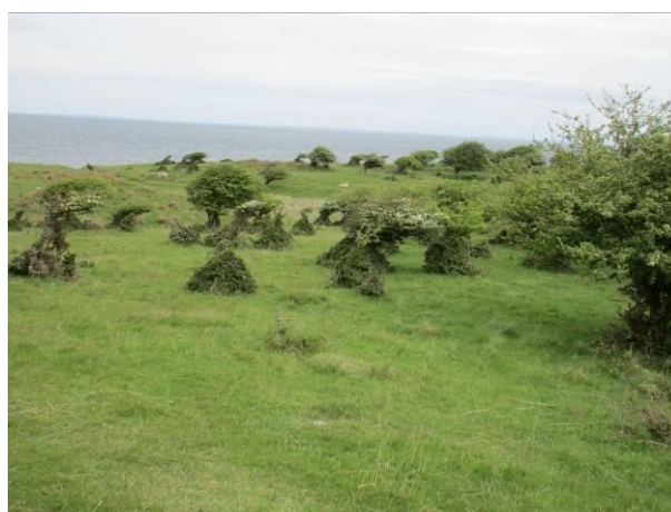
De bonsailignende hvidtjørne er dådyrenes værk